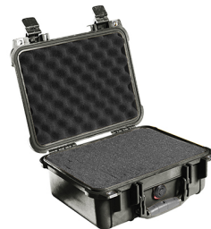
1400WF With Foam