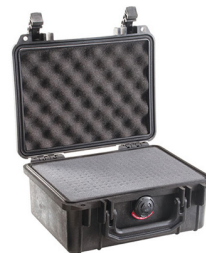
1150WF With Foam