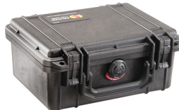
1150NF No Foam