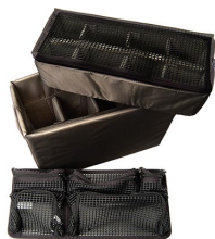
1445 Nützliches Einteilungssystem und Deckeleinteiler