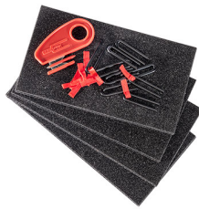
1506TPKIT TrekPak Koffer Teiler Kit