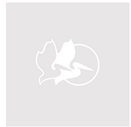
AL4824-1604RPFC With Foam, With Casters