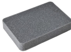
1052 Pick N Pluck™ Foam Insert