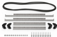
iM2600-M4-BEZEL-L Deckel-Lүнette (metrisch)