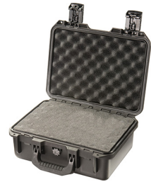
iM2100-X0001 With Foam