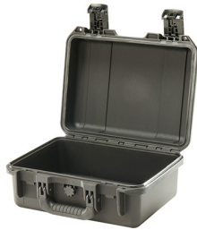
iM2100-X0000 No Foam