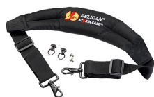
iM-STRAP-S-VER2 Padded Shoulder Strap