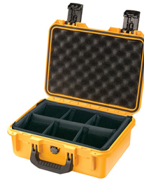
iM2100-X0002 With Padded Dividers