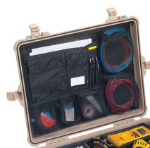
1609 Pochette couvercle