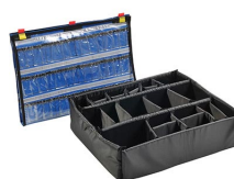
1605EMS Trousse d'accessoires EMS (classeur pour couvercle et jeu de séparateurs)