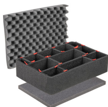
1520TPKIT Kit de séparation de la valise TrekPak