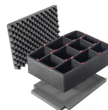
1500TPKIT Kit de séparation de la valise TrekPak