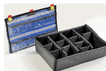
1505EMS Trousse d'accessoires EMS (classeur pour couvercle et jeu de séparateurs)