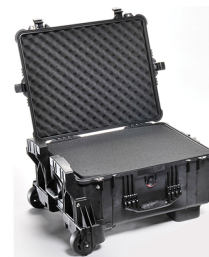
1610MWF With Foam