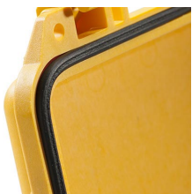
0343 Joint torique de remplacement