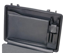
1498 Classeur à compartiments pour couvercle d'ordinateur