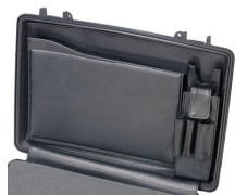
1498 Classeur à compartiments pour couvercle d'ordinateur