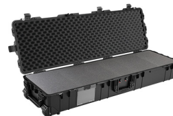
1770WF With Foam