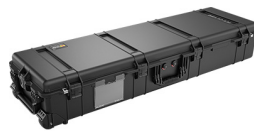
1770NF No Foam