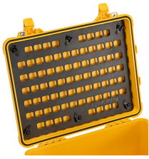
1560MP EZ-Click™ MOLLE Panel

c/ Provença, 388, Planta 7 • Barcelona, Spain 08025 • Phone: +34 934 674 999