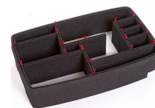
1510EUTP Kit de séparation de la valise TrekPak