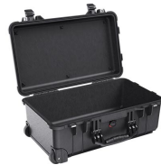
1510NF No Foam