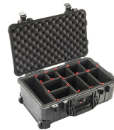
1510TP With TrekPak Divider System