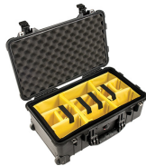
1514 With Padded Dividers