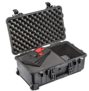
1510TPF TrekPak / Foam Hybrid