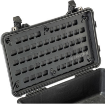
1510MP EZ-Click™ MOLLE Panel