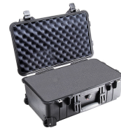
1510WF With Foam