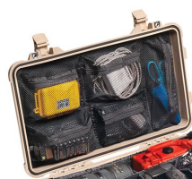
1519 Pochette couvercle