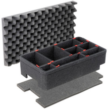
1510TPKIT Kit de séparation de la valise TrekPak