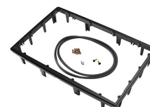
1490PF Cadre de panneau pour application spéciale