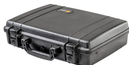
1470NF No Foam