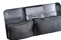
1449 Pochette couvercle Office