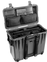
1447 With Padded Office Divider Set & Lid Organizer