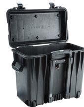
1440NF No Foam