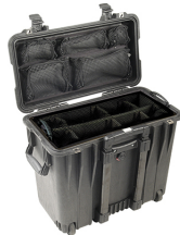
1444 With Utility Padded Divider Set & Lid Organizer