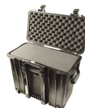
1440WF With Foam