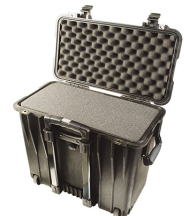
1440WF With Foam