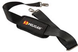
9487 Bandoulière rembourrée