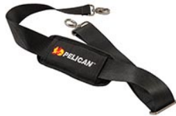
9487 Bandoulière rembourrée