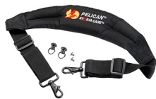
iM-STRAP-S-VER2 Bandoulière rembourrée