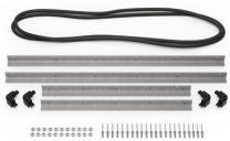
iM3075-MBEZ-B Lunette de base (métrique)