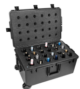
WINE-24B 24-Bottle Wine