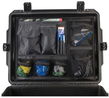
iM27XX-UTILITYORG Pochette utilitaire