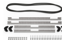
iM2750-M4-BEZEL-L Lunette du couvercle (métrique)