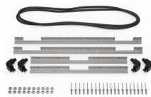
iM2700-M4-BESEL-L Lunette du couvercle (métrique)