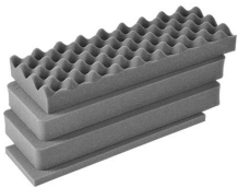
iM2306-FOAM Jeu de mousses de rechange, 4 pièces