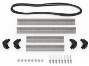
iM2200-MBEZ-B Lunette de base (métrique)