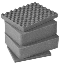
iM2075-FOAM Jeu de mousses de rechange, 4 pièces