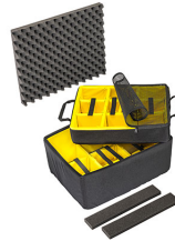
1607AirDS Cloison en mousse