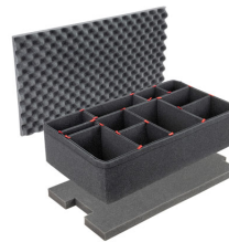
1615TPKIT Kit de séparation de la valise TrekPak