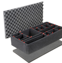
1605TPKIT Kit de séparation de la valise TrekPak