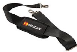
9487 Padded Shoulder Strap