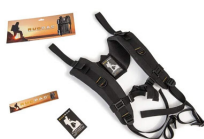
RucPac-normal RucPac Standard Hardcase Rucksack-Konvertierung