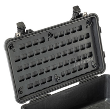
1510MP EZ-Click™ MOLLE Panel