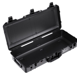
1705NF No Foam