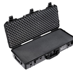
1705WF With Foam