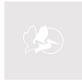
AL3022-0705RPFC With Foam, With Casters