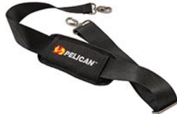
9487 Padded Shoulder Strap