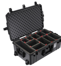
1595TP With TrekPak Divider System