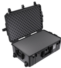
1595WF With Foam