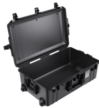
1595NF No Foam