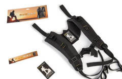
RucPac-normal RucPac Standard Hardcase Rucksack-Konvertierung