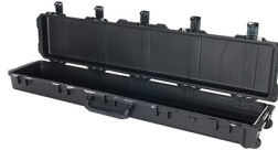
iM3410-X0000 No Foam