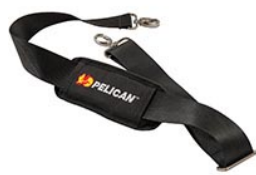
9487 Padded Shoulder Strap