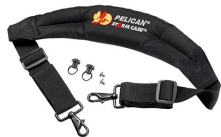
iM-STRAP-S-VER2 Padded Shoulder Strap