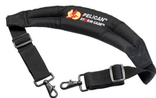
iM2370-STRAP-S Removal Padded Shoulder Strap