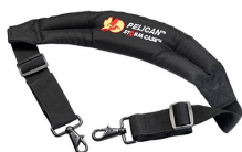
iM2370-STRAP-S Removal Padded Shoulder Strap