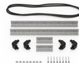
iM2306-MBEZ-B Bodenlünette (metrisch)