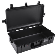
1605NF No Foam