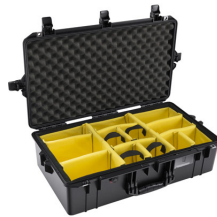
1605WD With Padded Dividers