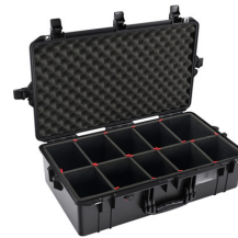
1605TP With TrekPak Divider System