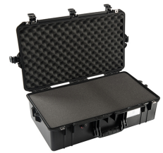
1605WF With Foam